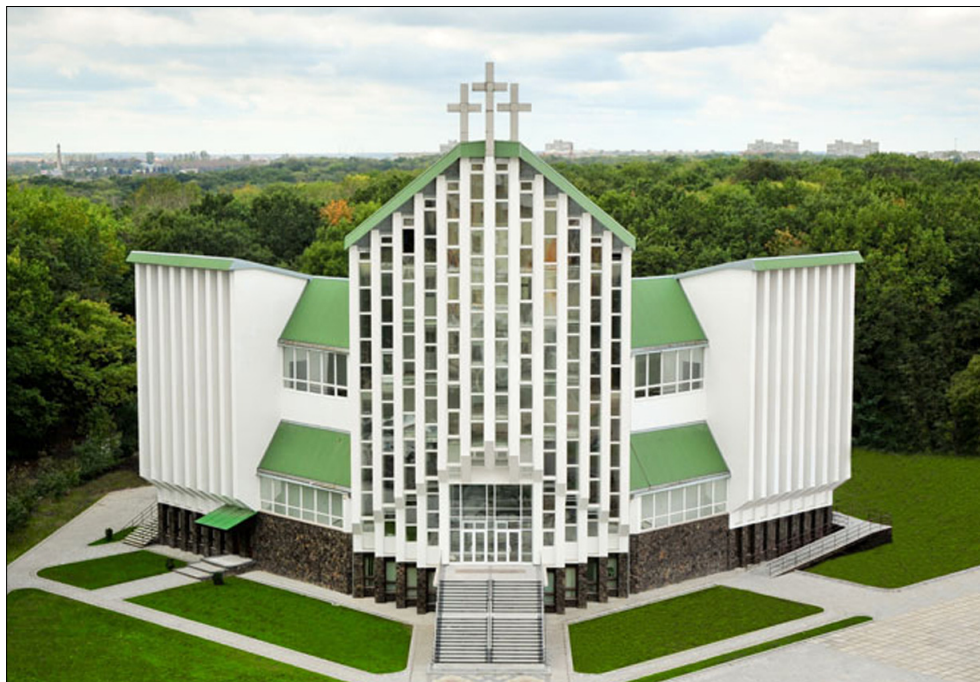
Дом молитвы «Голгофа» (г. Львов).

Архитектура многих современных домов молитвы стилистически отличается от ранних протестантских построек этого типа. Но присущую протестантизму символику и форму организации архитектурного пространства непременно можно проследить во всех протестантских храмах, потому что символика протестантизма исходит из глубинных убеждений верующих, их познания Бога через Писание, понимания святой жизни человека.