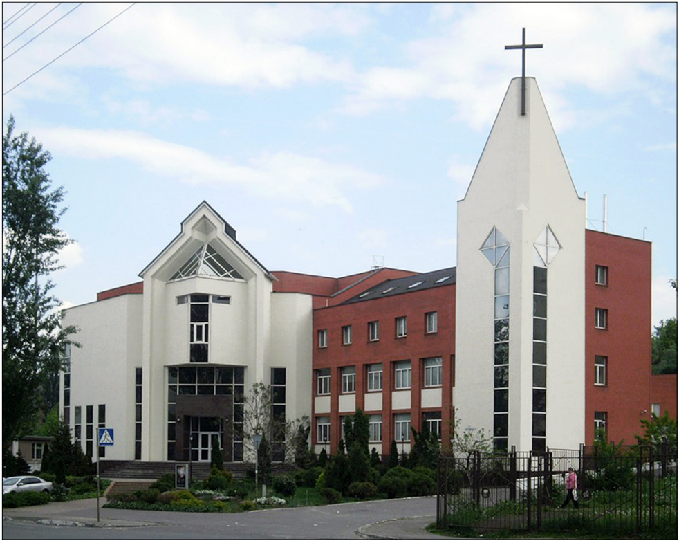
Дом молитвы «Филадельфия» (г. Киев).

имеет другую смысловую концепцию. Гранёная окружность здания с продлёнными по высоте окнами по всему периметру создаёт впечатления открытости, а повторяющиеся трижды с двух сторон архитектурные элементы — окна, аркады, крыши — указывают на Божественную Троицу. Шпиль завершает каскадный купол, крышу и стены создавая впечатление большого ветхозаветного шатра.