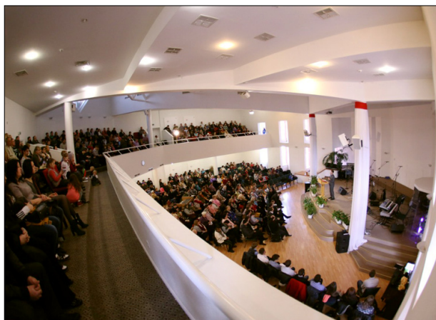
Интерьер дома молитвы «Филадельфия» (г. Киев).

для совместных молитв, духовного обучения, музыкальных и хоровых репетиций, занятий с детьми и молодёжных общений. Всё это помогает верующим ощущать общность друг с другом, и Бог — не где-то далеко, а среди всех и внутри каждого.