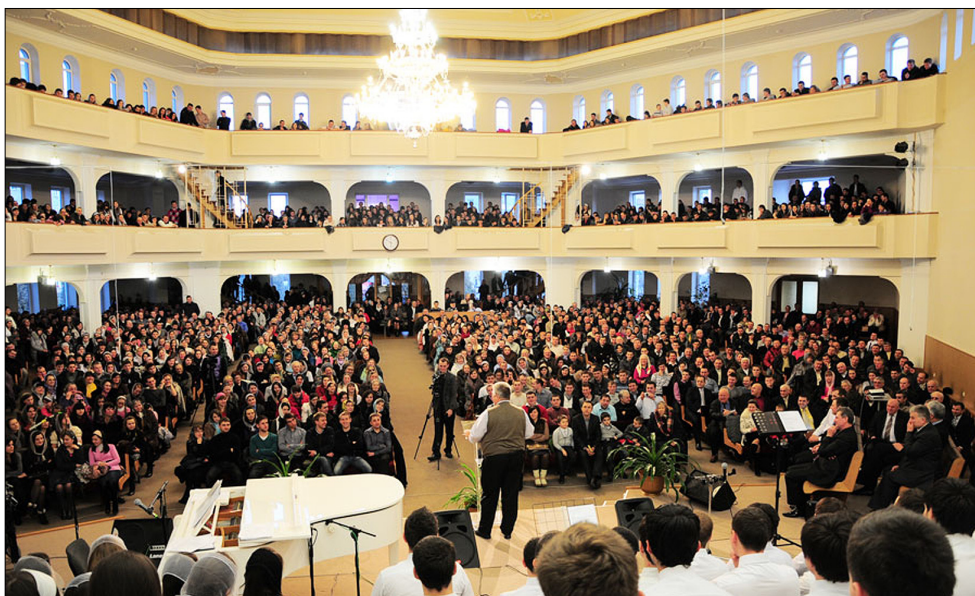
Интерьер дома молитвы «Вефиль» (г. Черновцы).

Другой пример архитектуры дома молитвы — церковь христиан веры евангельской «Вефиль» («Дом Божий», г. Черновцы, ул. Красноармейская, 246) —