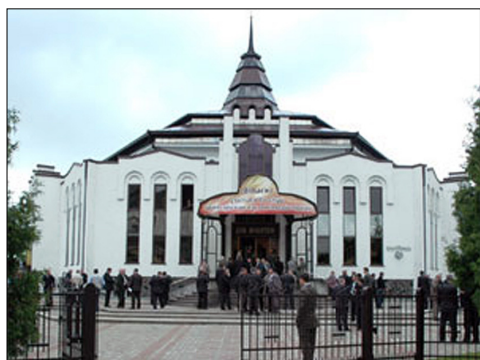
Дом молитвы «Вефиль» (г. Черновцы).

рьера — раскрытая Библия. Чуть справа возвышения для хора расположена кафедра — место, где читается и проповедуется Слово Божие. Места слушателей максимально приближены к кафедре.