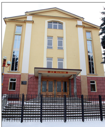
Дом молитвы ЕХБ, г. Черновцы.