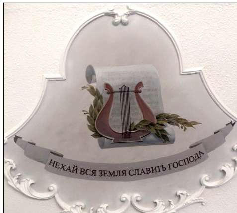
Декоративные украшения и символы «Библия», «лира» в дизайне интерьера дома молитвы ЕХБ, с. Недобоевцы, Черновицкая обл.

Особенно это проявилось в советское время. С одной стороны, сами верующие категорически выступали против помпезности домов молитвы и воздвижении на них креста, а с другой стороны, советская власть всячески ограничивала как само строительство, так и запрещала использование всякой наружной христианской символики в протестантской архитектуре. Преследование и ограничение любой интеллектуальной деятельности верующих привело к тому, что в протестантской среде периода независимости Украины оказался дефицит архитекторов и искусствоведов, которые могли бы в изменившейся ситуации профессионально обосновывать те или иные архитектурные проекты, подавать новые художественные идеи.