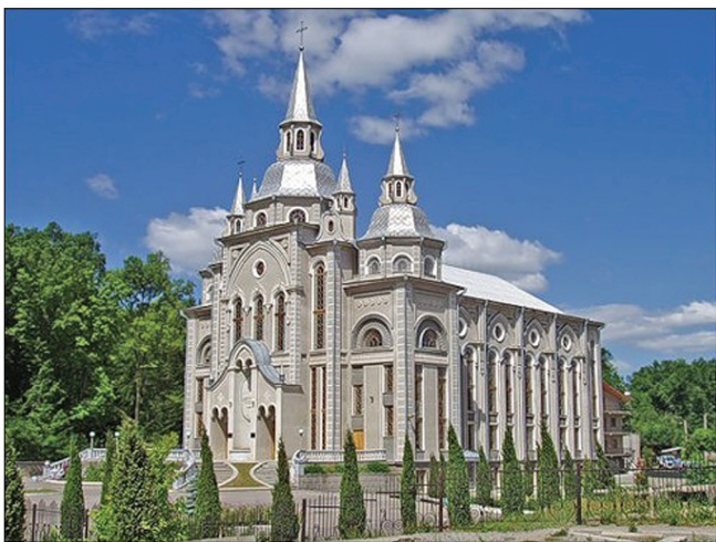
Дом молитвы ЕХБ «Дом Евангелия», г. Винница.

«Филадельфия» ХВЕ, г. Киев. В архитектуре этого современного здания просматриваются признаки стиля неоконструктивизма, который способствует решению образности храма, Здание призвано символично выражать «Новый Иерусалим» о котором говорится в книге Откровения, – символ защищённого города, где царит другая жизнь, нежели всё вокруг. Для это-