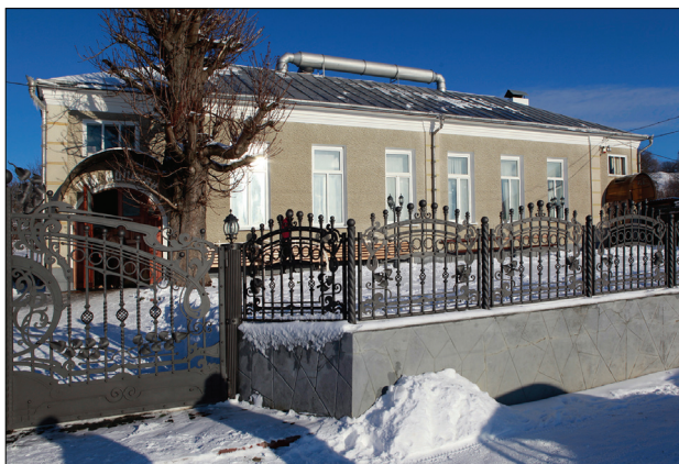
Дом молитвы ЕХБ, с. Недобоевцы, Черновицкая обл.

чти отсутствует как в экстерьере, так и в интерьере, хотя во внутреннем дизайне присутствовали декоративные украшения и другие символы, как «Библия», «лира», «виноградная лоза», «хлеб и чаша», «голубь», и др., а также цитаты из Библии.