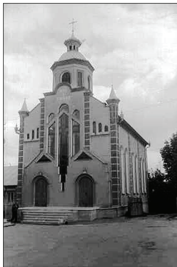
Лютеранская кирха, г. Немиров.

была небольшой – от 13 до 18 человек). Интересно, что в Подольской губернии Каменец-Подольский не был центром лютеранства. На Подолье такими центрами были Немиров (ныне – один из райцентров Винницкой области) и Дунаевцы. Немировский приход создан в 1782 г. при содействии польского магната Винсента Потоцкого. В 1801 г. в городе Немирове построили кирху, дом пастора и лютеранскую школу. Дунаевский приход создан в 1864 г. постановлением Министерства внутренних дел России. Она охватывала Каменецкий и Ушицкий уезды (включая и город Каменец-Подольский). Строительство кирхи в Дунаевцах продолжалось 7 лет и завершилось в 1866 г. Кирха была рассчитана на 520 мест (для сравнения: кирха в Каменце-Подольском имела 150 мест). В 1870 г. в городе Дунаевцы завершили строительство здания пастора. В 1904 г. в Дунаевецком лютеранском приходе насчитывалось более тысячи прихожан. Большинство из них (900) жили в самых Дунаевцах». [10]