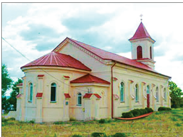
Шведская Свято-Михайловская церковь (кирха), с.Змеевка, Херсонская обл.

В Одессе первое здание евангелической церкви было сооружено в 1825–1827 годах по проекту архитектора Франциско Карловича Боффо. Здание имело 6-ти колонный портик с шатровой колокольной и было выполнено в строгом классическом стиле. Начатое архитектором Ф. К. Боффо строительство церк-