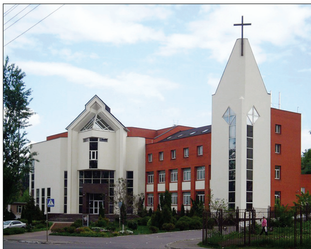
Дом молитвы ХВЕ «Филадельфия», г. Киев.

«Вефиль» ХВЕ, г. Черновцы. Эклектичное стилевое решение с реминисценцией неоконструктивизма и восточных мотивов создаёт лирический романтический образ. Гранёная окружность здания с продлёнными по высоте окнами по всему периметру подчёркивает впечатления открытости, а повторяющиеся трижды с двух сторон архитектурные элементы — окна, аркады, крыши —