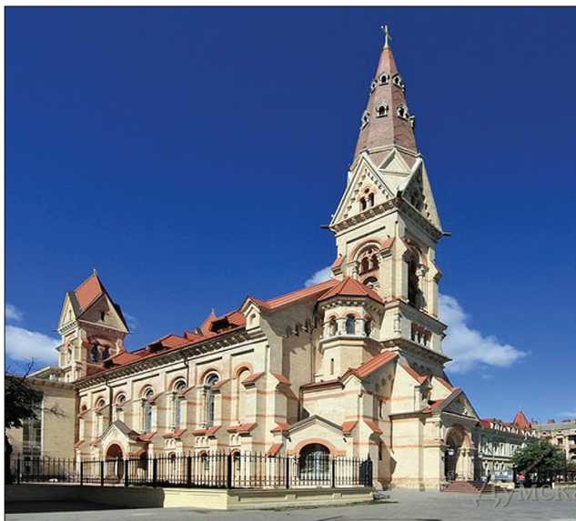
Лютеранская церковь (кирха) св. Павла, г. Одесса.

миссией губисполкома церковных ценностей из евангелическо-лютеранского прихода Св. Павла (общий вес серебряных изделий составил 2 фунта 70 золотников). В годы сталинских репрессий, когда жертвами становились священники и верующие всех религиозных конфессий СССР, пострадали и лютеранская община Одессы. В 1938 году в храме были прекращены богослужения, тогда же со шпиля кирхи был снят крест. В период румынской оккупации Одессы церковь Св. Павла вновь была открыта 7 декабря 1941 года и служила храмом вплоть до конца декабря 1943 года. После войны церковь Св. Павла использовалась в качестве спортивного зала и склада института связи. В алтарной части кирхи были устроены туалеты и душевые для спортсменов, а снаружи к зданию была пристроена прачечная, что привело к разрушению фундаментов из-за попадания воды и сточных вод. В 1970-е были планы по созданию в ней зала органной музыки, но после пожара, произошедшего в ночь с 9 на 10 мая 1976 года, здание полностью выгорело. Есть основания предполагать, что это был умышленный поджог, хотя виновные так и не были найдены.