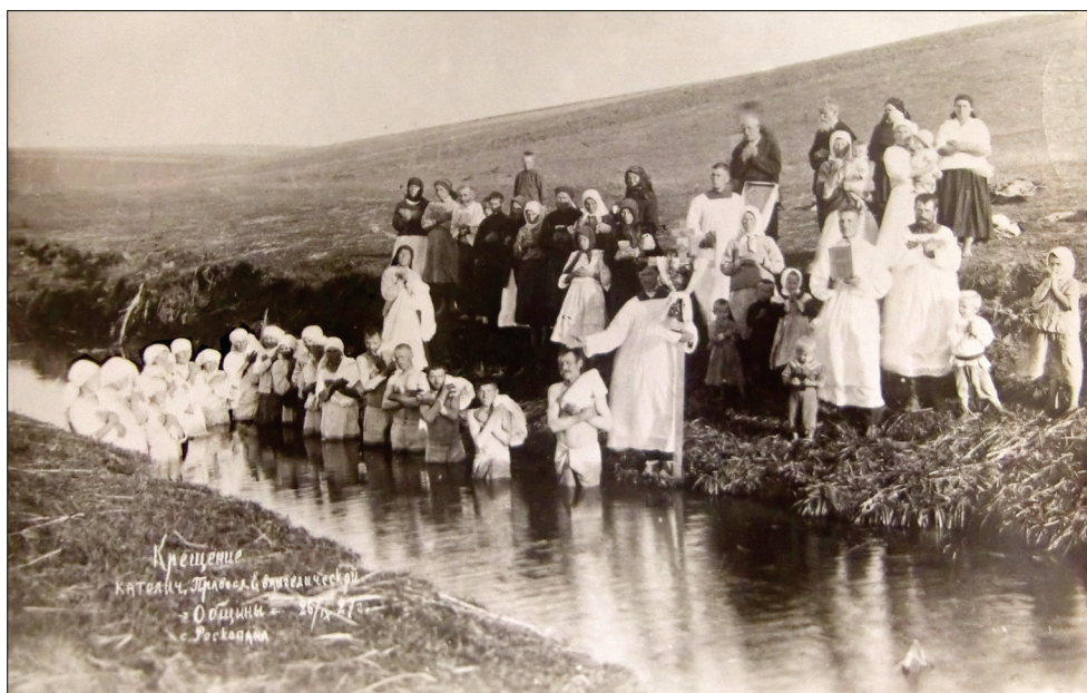
Хрещення «Католицько-православної євангельської громади» (с. Розкопане, 26.IX.1927).