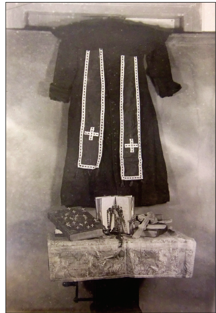
Богослужбове облачення й інші предмети, skonфісковані у апокаліпсистів (1935 р.).

Станом на 1958 р. в області все ще було на обліку 26 груп апокаліпсистів із загальною кількістю 1350 членів. [14] В період хрущовської атеїстичної кампанії уповноважений у справах культів рапортував про швидке зменшення їх чисельності: вже в 1959 р. він фіксував їх усього 12 груп (160 чол.), а в 1964-му – 15 груп (152 чол.). [15] У 1982 р. уповноважений зняв з обліку останні групи апокаліпсистів як такі, що саморозпалися. Однак ці цифри, ясна річ, не надто достовірні з огляду на особливості радянської бюрократичної звітності про релігійне життя, коли чиновникам вигідно було применшувати або замовчувати масштаби релігійності, особливо нелегальної. В кожному разі, Апокаліпсична Церква існує дотепер. Ще в останні роки існування СРСР апокаліпсисти почали діяти відкрито. На 1992 рік вони мали дві зареєстровані громади, а сьогодні у Вінницькій області діє п'ять зареєстрованих громад (одна в По-